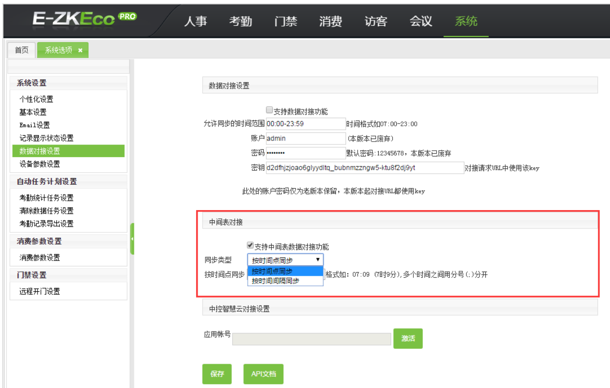
图 1 (系统选项->数据对接设置->中间表对接)